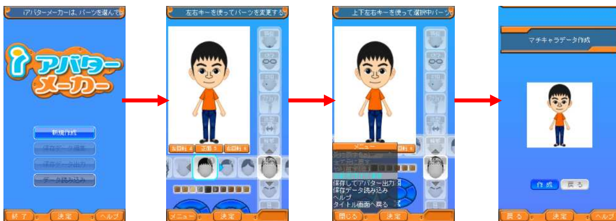
「iアバターメーカー」を利用したアバター制作のフロー

NTT ドコモの新シリーズ「docomo STYLE series」、 「docomo PRIME series」の端末(一部機種を除く)を利用するユーザは、プリインストールされている、オリジナル・フェイスのアバターの自由に作成できるiアプリ「iアバターメーカー 2」を利用できます。ユーザは、自由に自分の好みの顔を作成することが可能であり、さらに、オリジナリティ溢れるアバター表現が可能になります。(「iアバターメーカー」で作成可能なアイテムはフェイス部分などのアバターの一部となります)。「iアバターメーカー」の月額利用料金は無料です。