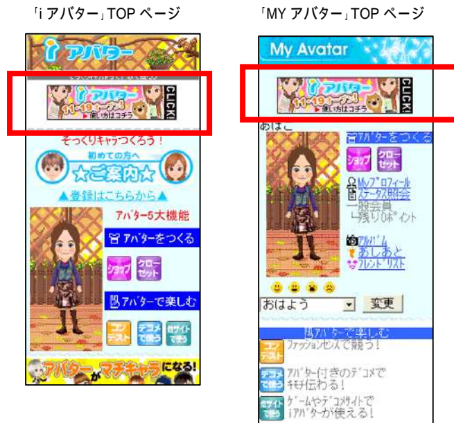
ピクチャー広告の掲載イメージ

「アバター」コーナーには、広告スペースを設置し、D2C が販売を行ってまいります。当初は、ピクチャー広告を中心とした広告商品を販売いたします。