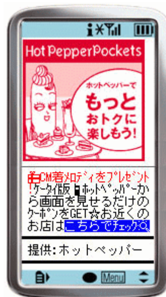
株式会社リクルート 「ホットペッパー」プロモーション