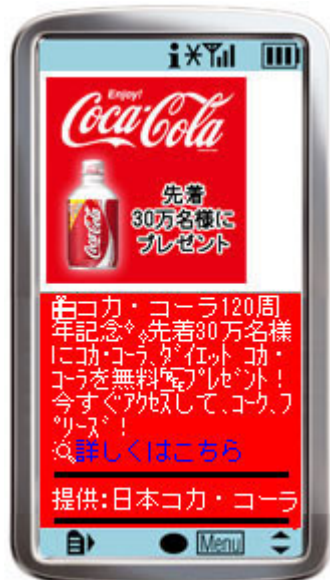
日本コカ・コーラ株式会社 コカ・コーラ 120 周年記念 キャンペーン