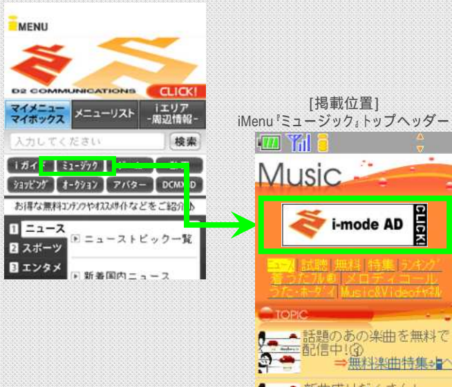
[掲載位置] iMenu『ミュージック』トップヘッダー